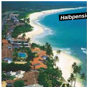
Koggala / Galle

Hotelzuschlag p.P./Tag: 1.7. - 31.8.12 auf Anfrage